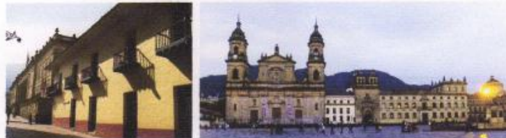
Fig. 1.1.- Fachada norte del Capitolio Nacional en la Plaza de Bolívar de Bogotá, Carrera 8ª y fachada de una casa colonial sobre el costado sur de la Calle 10ª de la Ciudad 1 . Fig. 1.2.- Panorámica del costado oriental de la Plaza de Bolívar de Bogotá: de izquierda a derecha aparecen la Catedral Primada, edificio de almacenes religiosos, Capilla del Sagrario y Palacio Arzobispal y Plazuela de San Bartolomé 2 .

Bogotá, Colombia, 23 a 25 de noviembre de 2017